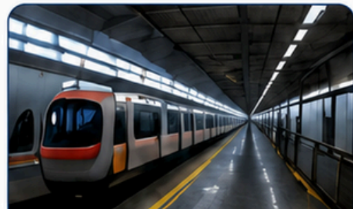
สถานีรถไฟ