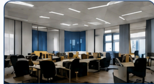
อาคารสำนักงาน