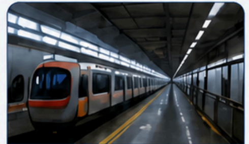
สถานีรถไฟ