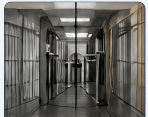
พื้นที่ที่ต้องเฝ้า การเข้าถึงจำกัด