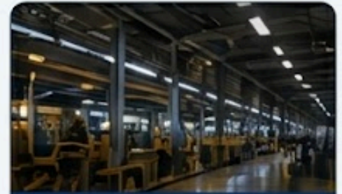
โรงงานอุตสาหกรรม