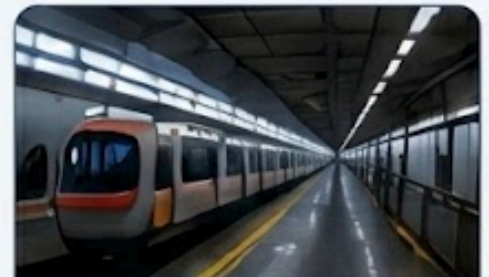
สถานีรถไฟ